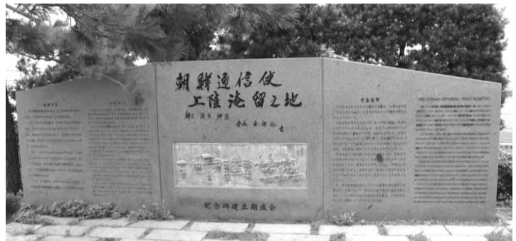
조선통신사 상륙엄류지 지 기념비

이 비는 통신사가 시모노세키에 기항*했던 것을 기념하고자 세운 것이다. 통신사는 전쟁 이후 단절된 조선과의 국교 재개를 바라는 (가) 막부의 요구를 받아들여 파견되었다. 이후 19세기 초까지 파견되어 조선과 일본의 평화 유지와 문물 교류에 기여하였다.