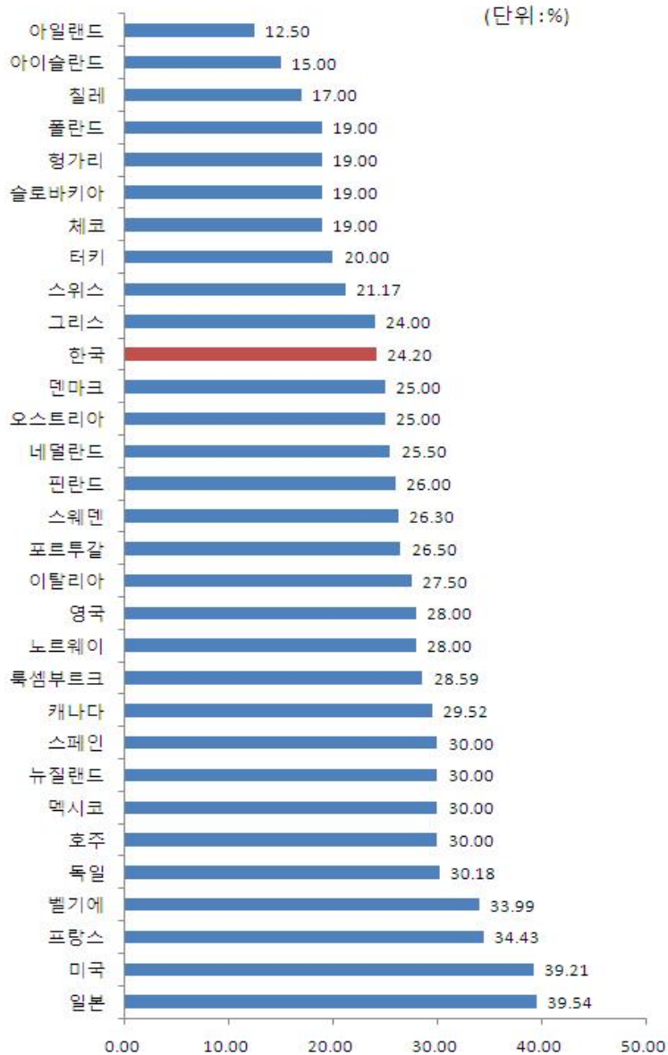
OECD 국가 2010년 법인세 최고세율비교